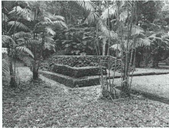
Foto 4. Grupo Residencial Oeste