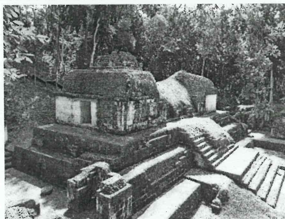
Foto 7. Edificio G, Nakum