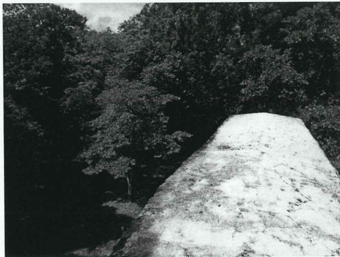
Foto 3. Techo del Edificio 389, Acrópolis Sur