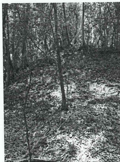
Foto 9. Montículo, sitio arqueológico La Pochitoca