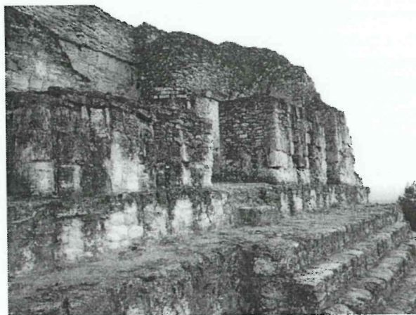
Foto 1. Templo, Edificio 216