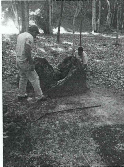
Foto 6. Limpieza de estelas